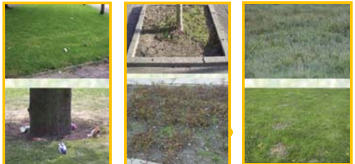
FIGUUR 1: Voorbeelden aan te houden beeldkwaliteit

Wilt u meer weten over de kwaliteit in uw wijk? Informatie hierover kunt u krijgen bij het Meldpunt aan de Bergenboulevard 161.