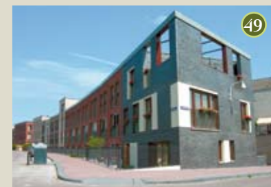
P) special Brugwoning A) Architecten Cie O) BAM