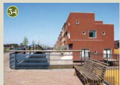
P) special: Schoener A) Architecten Cie O) Amerstaete