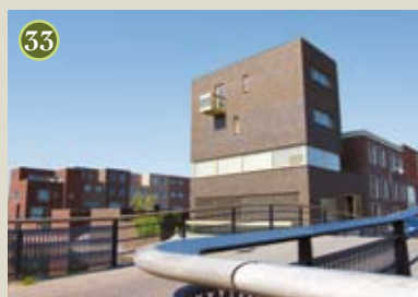
P) special: Schoener A) De Zwarte Hond O) Amerstaete