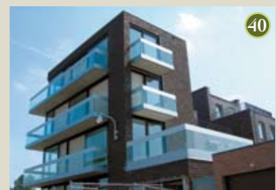
P) special: Pythagoras A) Architecten Cie O) Amerstaete vof