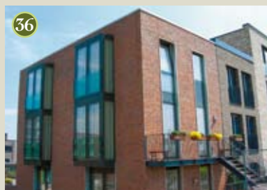
P) special: Weteringwoning A) Architecten Cie O) BAM