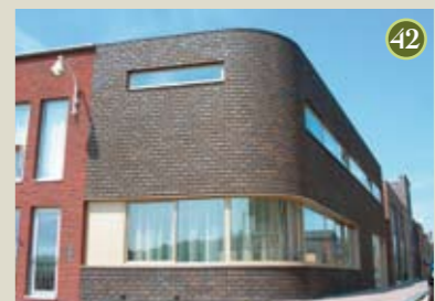
P) special: Socrates A) De Zwarte Hond O) Amerstaete vof