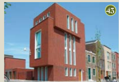
P) special: Michelangelo A) Architecten Cie O) Amerstaete vof