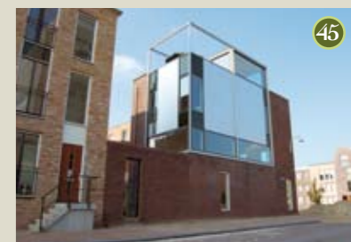
P) special: Bascule A) Babet Galis O) De Alliantie/Heijmans