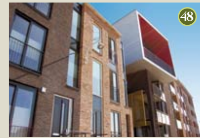
P) special: Bascule A) Babet Galis O) De Alliantie/Heijmans