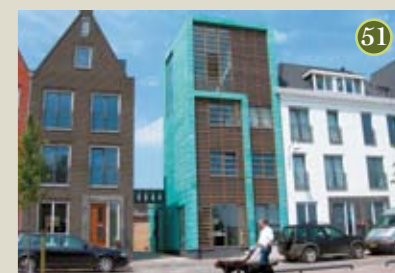
P) special G2 A) Architectenbureau Van Maanen O) Heijmans