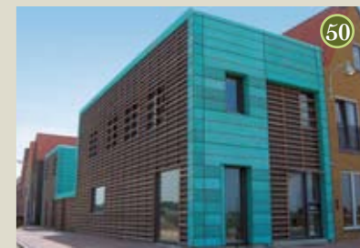
P) special G1 A) Architectenbureau Van Maanen O) Heijmans