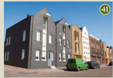
P) special: Edzo A) Bindels O) De Alliantie/Heijmans