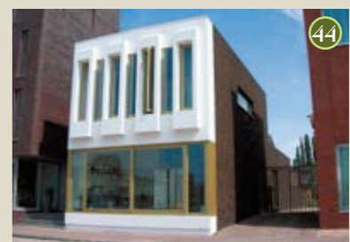
P) special: Villa Plato A) De Zwarte Hond O) Amerstaete vof