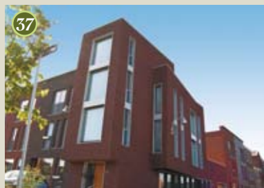
P) special: Logger A) Architecten Cie O) Amerstaete vof