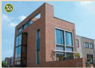
P) special: Waterwoning A) Architecten Cie O) BAM