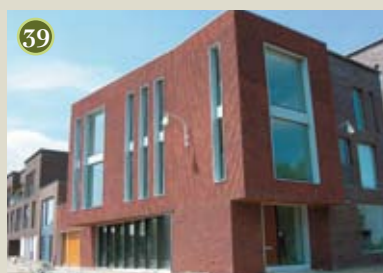
P) special: Cicero A) De Zwarte Hond O) Amerstaete vof